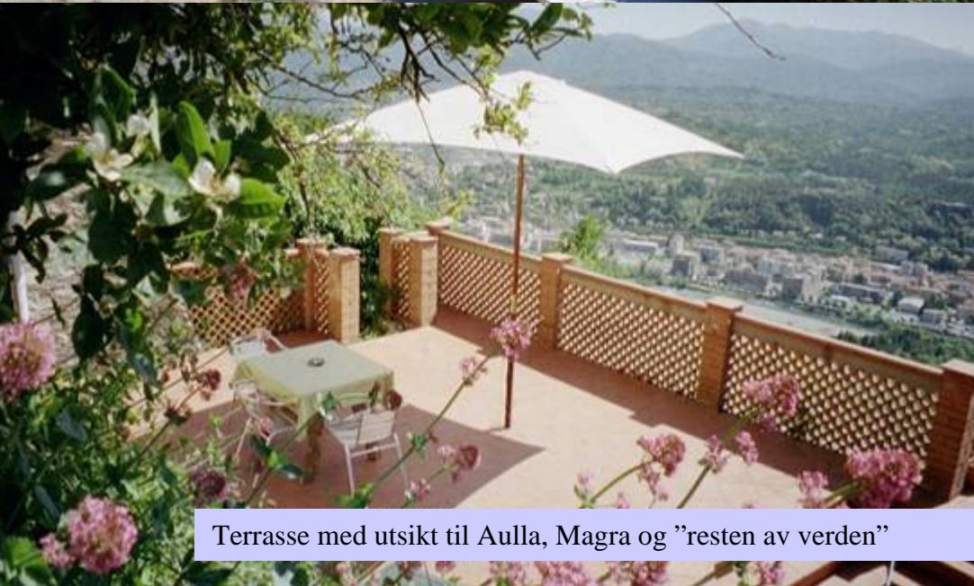
Terrasse med utsikt til Aulla, Magra og "resten av verden"