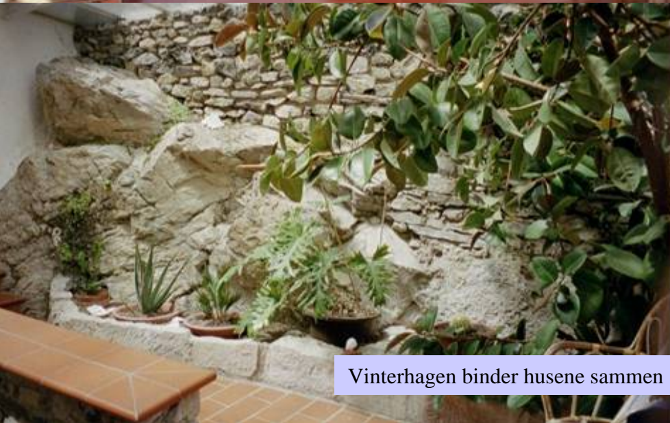
Vinterhagen binder husene sammen

Huset har også eget verksted, fyr- og lagerrom. Alt helt usjenert uten innsyn og gjenboere.