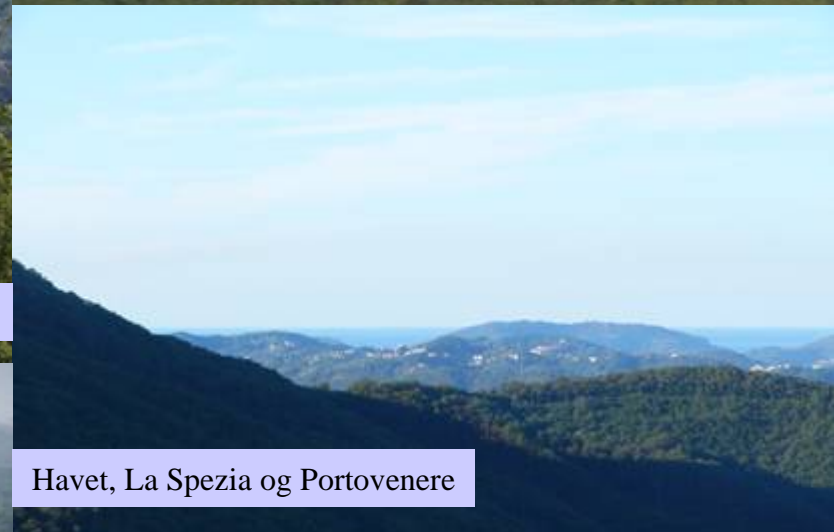
Havet, La Spezia og Portovenere