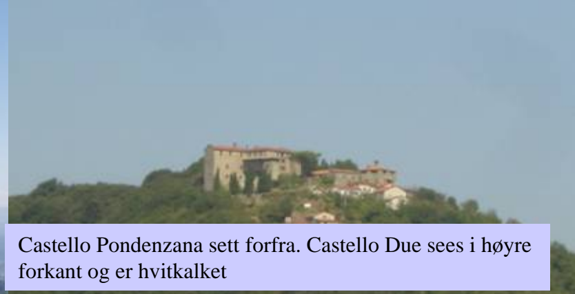
Castello Ponzana sett forfra. Castello Due sees i høyre forkant og er hvitkalket