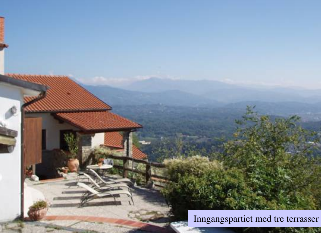
Inngangspartiet med tre terrasser