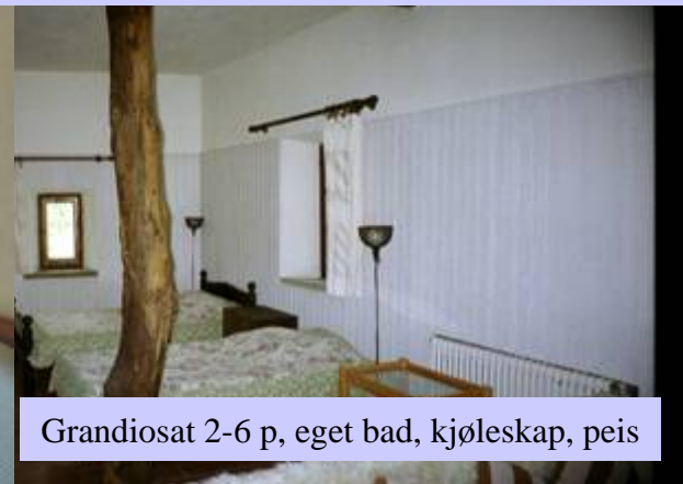
Grandiosat 2-6 p, eget bad, kjøleskap, peis