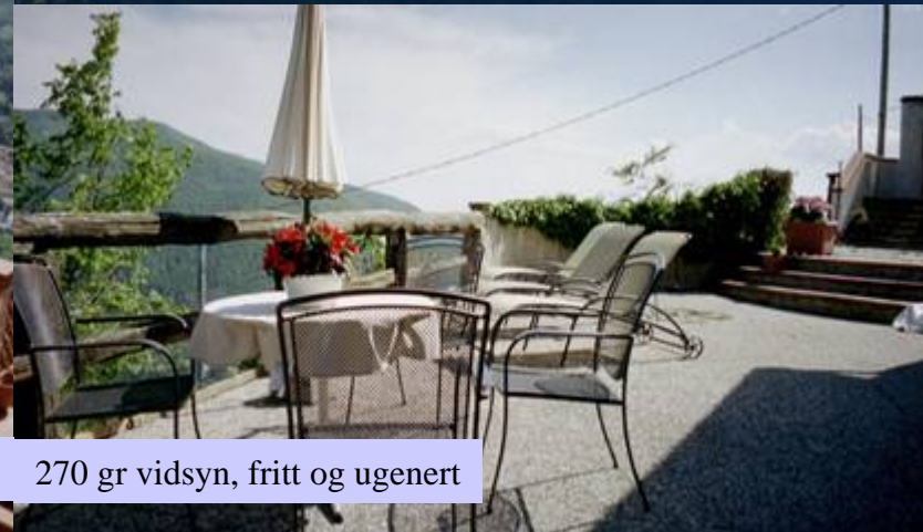
270 gr vidsyn, fritt og ugenert