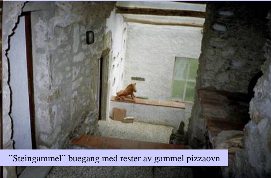
”Steingammel” buegang med rester av gammel pizzaovn