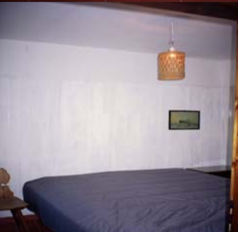
Veneziarommet dobbeltseng 2p

5 soverom. Nye gode senger To med egne (frokost)-terrasse