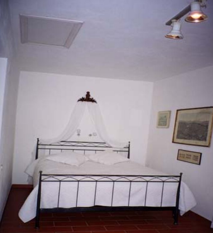
'Master room' med egen frokost-terrasse